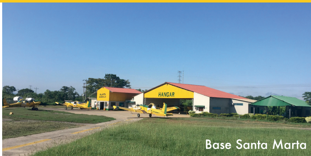
Base Santa Marta